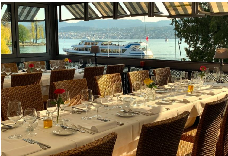
Seesicht im Restaurant Steinburg

Bemerkungen: Das Restaurant Steinburg ist eines der wenigen am Zürichsee mit direktem Seeanstoss. Wir sitzen im Wintergarten mit Seesicht, siehe Bild unten.